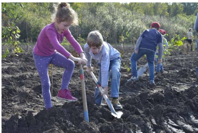
A Norbert-Scheed-Wald telepítésében gyerekek is részt vettek.

A European Forest City címet az osztrák főváros - a zöldterületek magas aránya mellett - a bécsi ivóvízbázis védelméért vehette át, és egy éven keresztül viselheti. Bécs egyike Európa legzöldebb városainak, területének 20%-át borítják erdők, emellett pedig immár 150 éve látja el lakóit kiváló minőségű, a környező hegyekben eredő forrásvízzel. A cím adományozásakor szintén az osztrák főváros mellett szólt, hogy az új városrészében, Seestadt Aspermben épül a világ legmagasabb, 24 emeletes fa toronyháza.